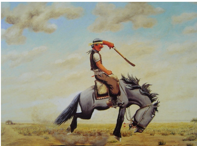
Florencio Molina Campos

Aunque numerosos cambios expresaron el alejamiento del gaucho y el establecimiento campesino del criollo, en éste quedan rastros de una representación gauchesca. Unos de los cambios citados culminan en la actualidad que estudiamos, donde ocurre por ejemplo, un pasaje de creencia, del antiguo catolicismo al evangelismo. Se trata sin embargo, de una creencia capaz de convivir con las devociones hacia santos populares (historias criollas de rebeldía e independencia personal). La mujer, la china , mantiene un marcado rol ecuestre, de “a caballo” en la vida criolla actual que la coloca junto a los varones. En el caso de los criollos que describimos, hay una fuerte persistencia de la vida ganadera y del orgullo ecuestre, tal como lo retrata en prologadas series el artista Florencio Molina Campos