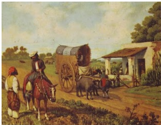
Prilidiano Pueyrredon (1823-1870) “Un alto en la pulpería”

La pulpería sería el centro de reunión y paso de aquellos gauchos en constante movimiento.