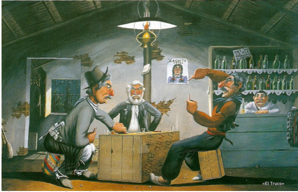
Florencio Molina Campos, "el truco"

como alternativa al sombrero, el chiripá gauchesco deja lugar a las bombachas 12 , las botas se reemplazan por alpargatas 13 , tal cambio lo reflejan las pinturas (por ejemplo del artista Florencio Molina Campos), que exponen un nuevo retrato de la vida social, que manifiestan nuevos aspectos de la vestimenta. También, los cambios progresivos se advierten en el tipo de comercio que representa el paso de la pulpería al boliche y tienda o almacén de campo.