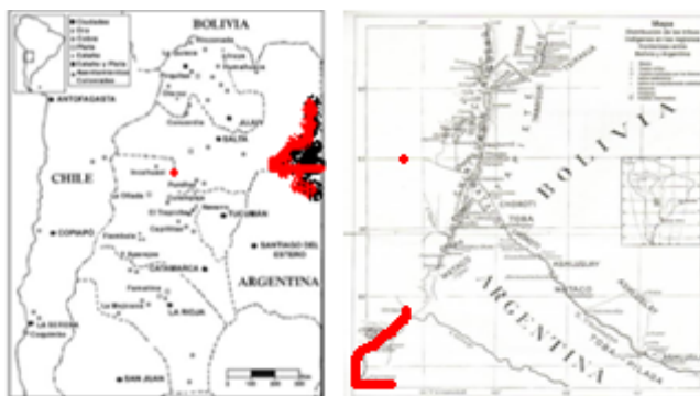
En el mapa se observa coloreada la región de contacto con la región occidental de la Pcia. del Chaco

En el transcurso de su historia local el criollo se relaciona y en ocasiones se funde con el antecedente sociocultural del gaucho , quien en sí mismo ha sido una específica resultante mestiza de riquísimo contenido, cuya característica distintiva es que se vislumbra como un personaje solitario y en movimiento a través de una frontera entre las poblaciones criollas y las áreas lideradas por grupos aborígenes. Se lo encuentra al gaucho como emergente de un medio espacial y cronológico ambivalente, especialmente situado entre “el indio y el cristiano”, dicotomía que distinguía a europeos y criollos por un lado, y poblaciones aborígenes diversas, por el otro.