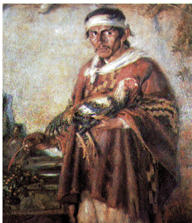
Cesáreo Bernaldo de Quirós " El embrujador" col.1926-1927.