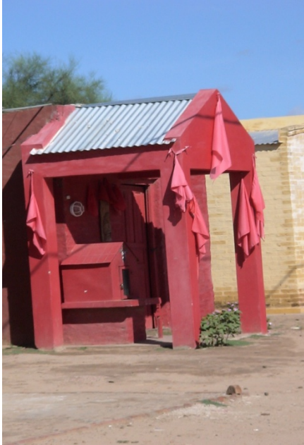
Templo del Gauchito Gil en el pueblo

Estas canonizaciones populares pueden darse en un margen regional que abarque toda un área cultural y en casos los trasciende. El gauchito Gil en Corrientes es una canonización popular originada por el marco de las Guerras Civiles de la provincia en el siglo XIX y que muy recientemente fue llevada por correntinos migrantes y sigue difundiendo (de París, 1988, pp. 25-32).