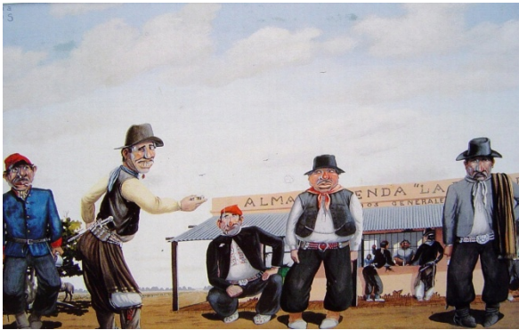
Florencio Molina Campos.

Pero muchos aspectos de la vida criolla reflejada entonces podrían representar una escena actual de la vida del criollo del chaco noroccidental, que conjuga aquellos cambios y persistencias en su vida presente.