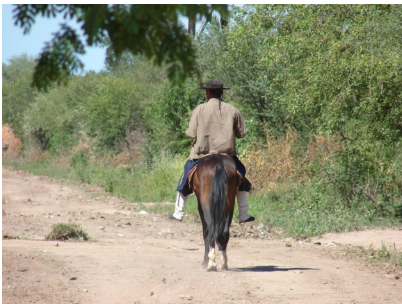
Criollo. Nueva Pompeya (Chaco)

una representatividad que el criollo no posee. De tal modo, hay una serie encadenada de hechos que confluyen en cierto aislamiento y agotamiento del modelo sociocultural criollo local. Por otra parte, en el ámbito chaqueño se encuentran lejos, por ejemplo, de organizar asociaciones campesinas mientras van perdiendo sus tierras por la venta de la tierra pública a los grandes productores o vendiendo sus tierras, o sencillamente siendo estafados y acosados por la marginación social 19 . En los tiempos actuales hay un alto nivel de subocupación de la mano de obra joven en el campo. La limitación señalada empuja al joven criollo a migrar, por ejemplo al conurbano bonaerense, para emplearse en fábricas como obrero, insertándose en un ámbito que reconocen inseguro y completamente diferente del que quisieran habitar (Caputo, 2000). Un problema central gira en torno del sentido de pertenencia de la tierra que sin embargo muchas veces no es sino territorio fiscal o aborigen donde en su mayoría realizan la actividad productiva en forma familiar concentrada en una ganadería extensiva caracterizada por una inversión tecnológica muy baja 20 .