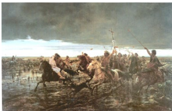
Ángel del Valle (1855-1903); La vuelta del malón.

Por lo demás, parece que los cristianos no quieren que los indios se dediquen a la agricultura. Se me aseguro que habiendo aquellos encontrado campos sembrados por indios amigos de esa frontera, destruyeron toda la labranza, y que desde aquel entonces los indios de allí no han vuelto a cultivar ni un palmo de tierra. Esta intención responde al interés que tienen de impedir que los indios tomen posesión (reconocida ahora también como legítima por las leyes argentinas) de los excelentes terrenos que los cristianos limítrofes o vecinos codician como buena presa para el porvenir.