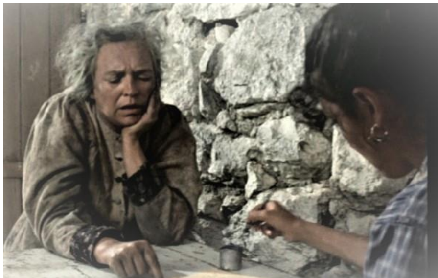
1. Fotograma de la película Kaos , Hermanos Taviani.