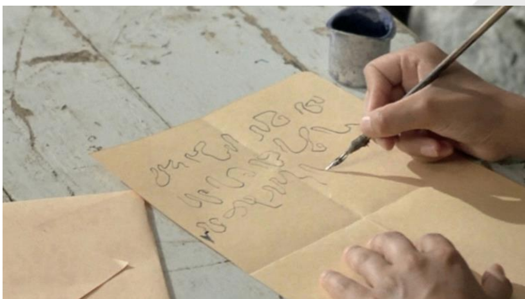
2. Fotograma de la película Kaos , Hermanos Taviani.