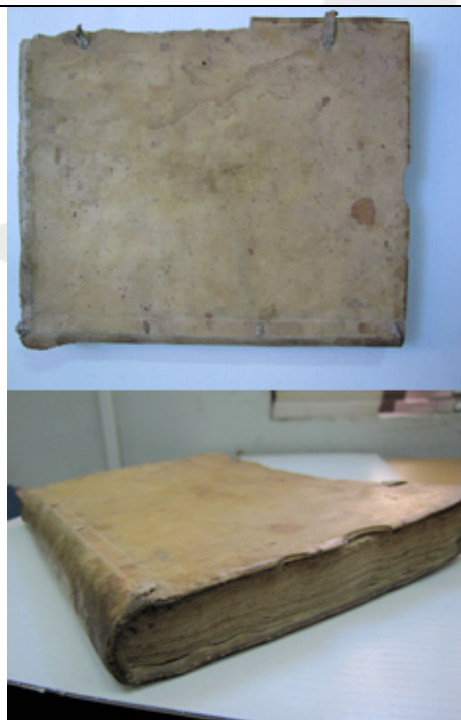
Detalle: tapa frontal y corte del pie