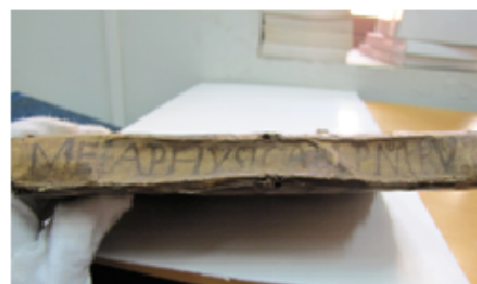
Detalle: Tapa frontal y lomo