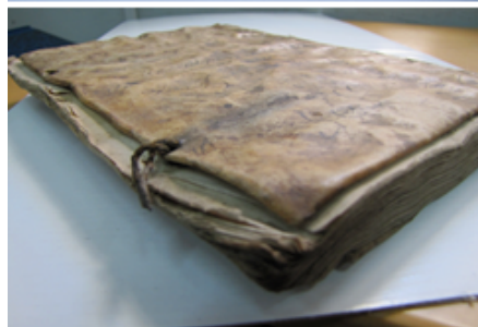
Detalle: Tapa frontal y cortes